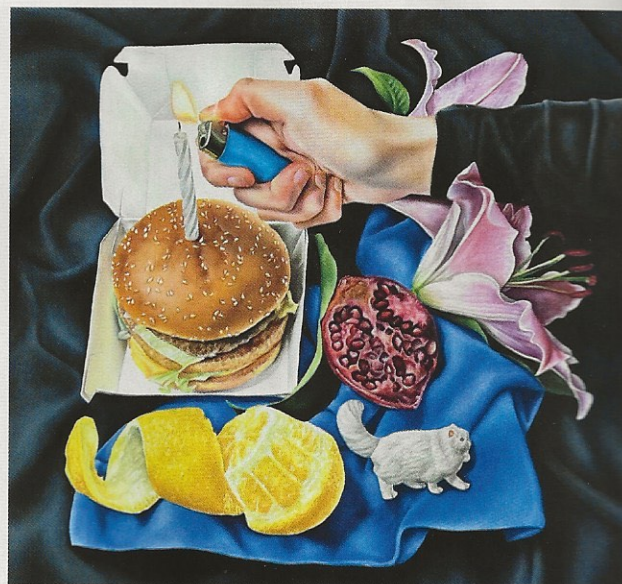
Reem R., Last Night , 2020 , huile sur toile. Jeune artiste palestinienne, Reem R. utilise la peinture pour documenter son quotidien avec humour, dans un style pop qui rappelle l'esthétique Instagram.

📍 Menart Fair Paris , du 15 au 17 septembre 2023, Palais d'Iéna, Paris-16 e , menart-fair.co